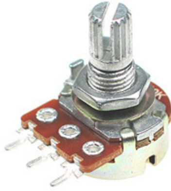
×1 مقاوم متغير (10 kΩ variable resistor)