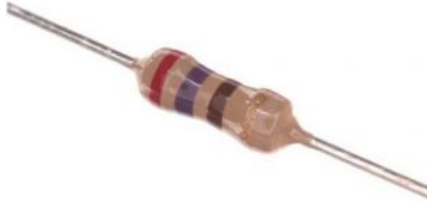
( \Omega Resistor 270) ×8