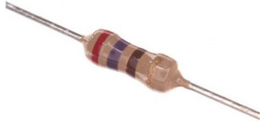
( \Omega Resistors 270) x1