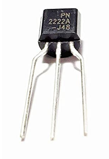
×1 (PN2222 Transistor)