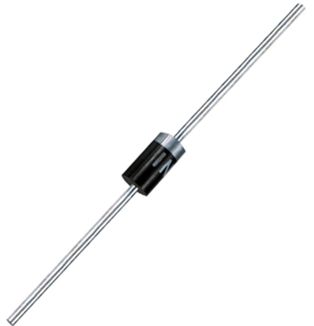
×1 صمام ثنائي 1N4001 diode