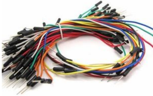
حزمة أسلاك توصيل (ذكر- ذكر)