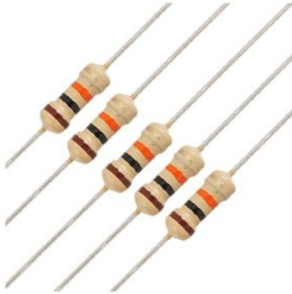
×5 مقاومة 220 Ω