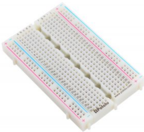
1 × لوحة تجارب - حجم كبير