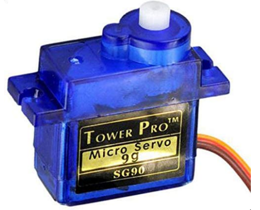
×3 محرك سيرفو (TowerPro SG90 micro servo)