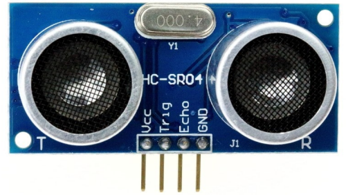
×1 حساس المسافة (HC-SR04)