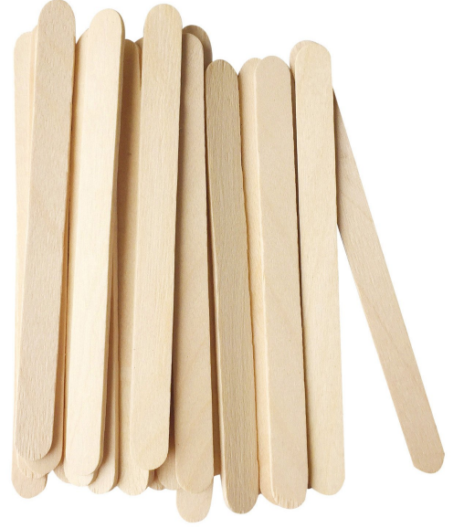
3 × أعود خشبية