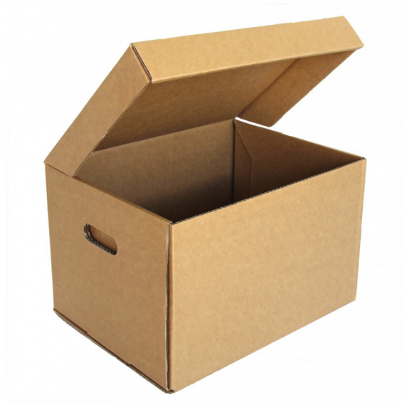
×1 هيكل اللعبة