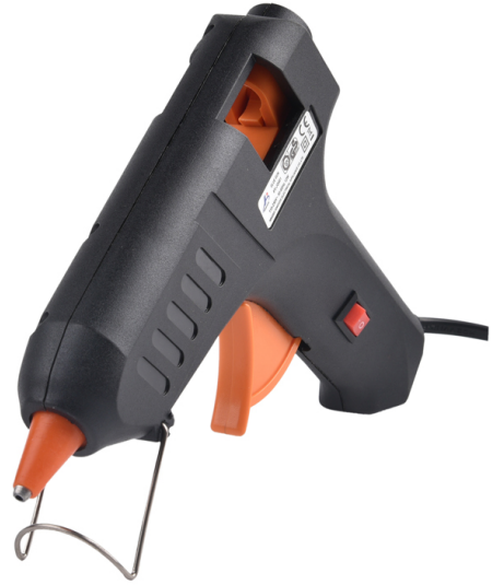
1 × غراء مسدس