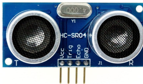
×1 حساس المسافة (HC-SR04)