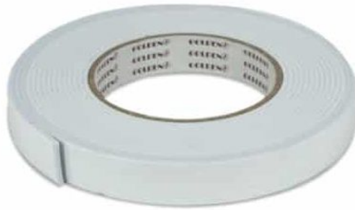
×1 شريط لاصق ذو وجهين