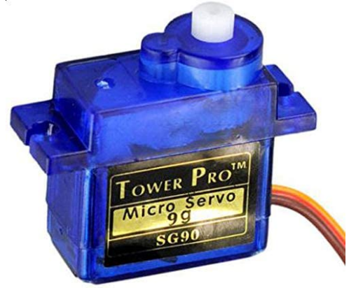
×2 محرك سيرفو (TowerPro SG90 micro servo)