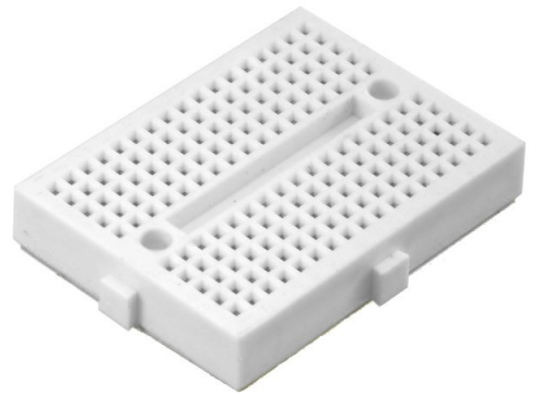
1 × لوحة تجارب حجم صغير