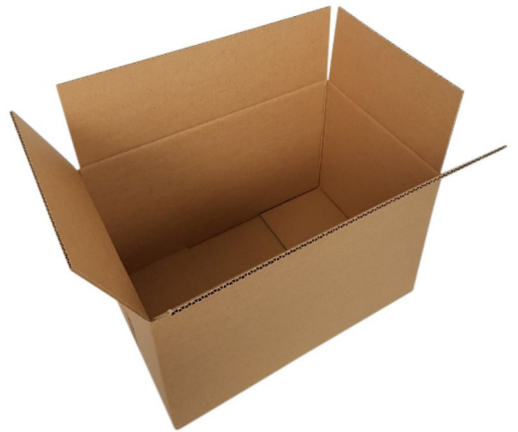
×1 قالب كرتوني أو فليبي لإعداد هيكل السلة