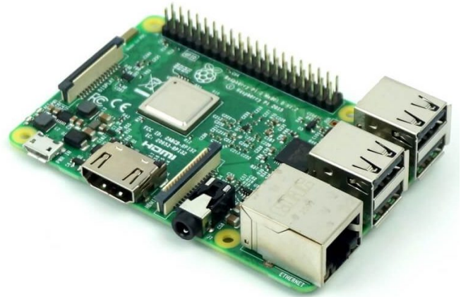
1X راسبيري باي