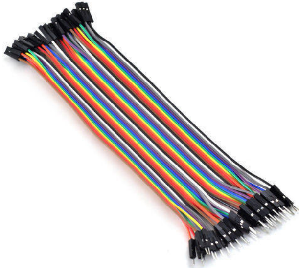
مجموعة أسلاك توصيل