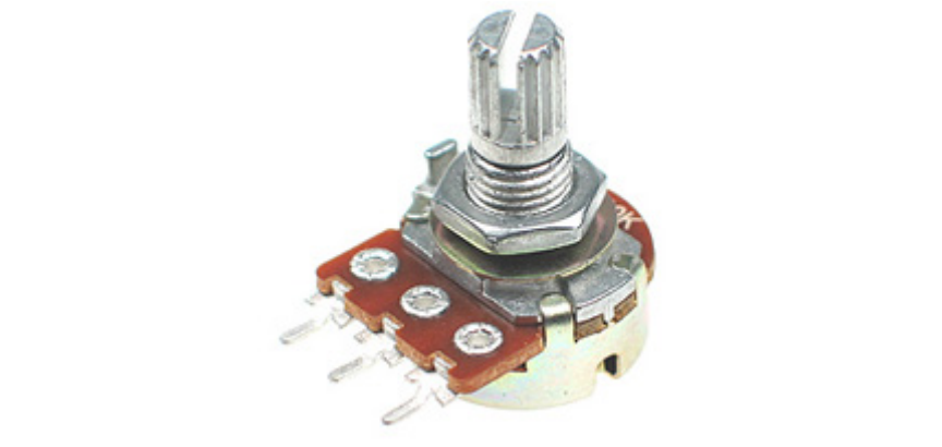
1X مقاومة متغيرة