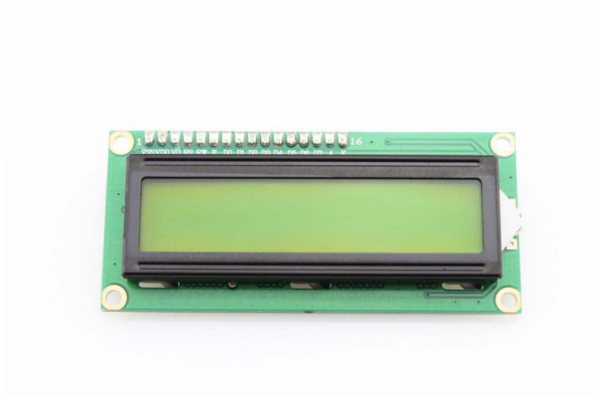
1X شاشة كرسنالية (LCD)