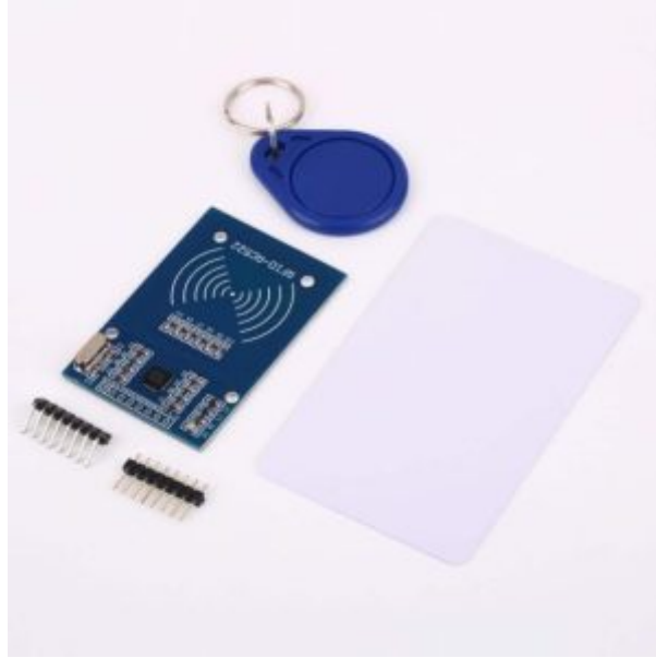
1 X قارئ (RFID)