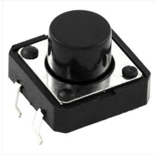
X1 ضغط تحكم