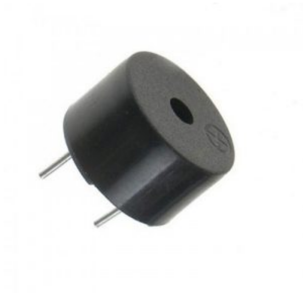
X1 مصدر صوت