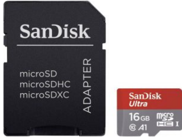
×1 كرت ذاكرة