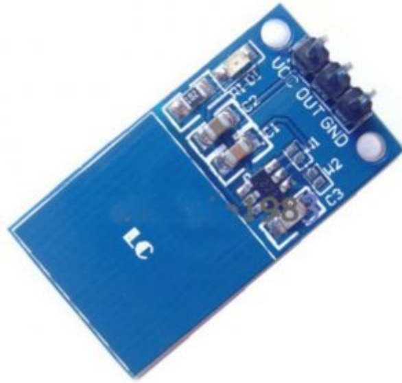
x1 حساس اللمس