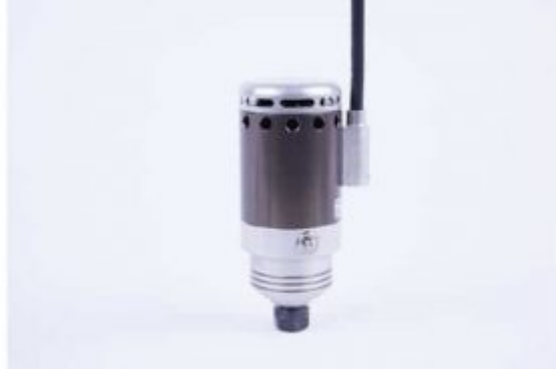
HF Spindle 500W