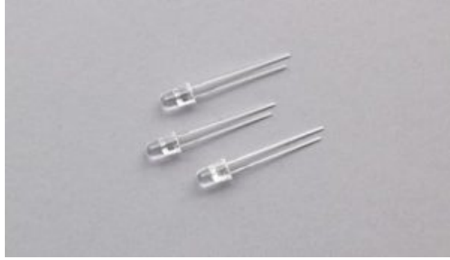
LED العدد : 3