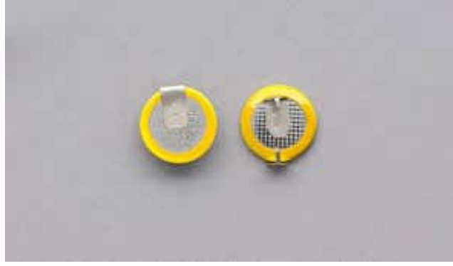
بطارية العدد : 1