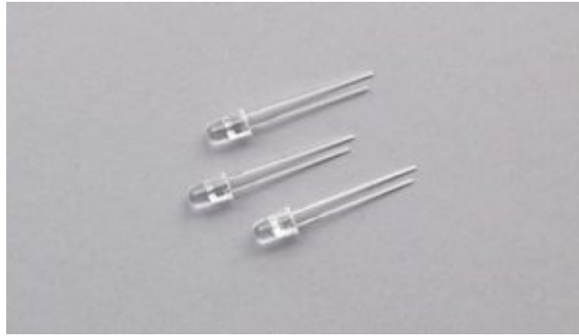
LED العدد : 3