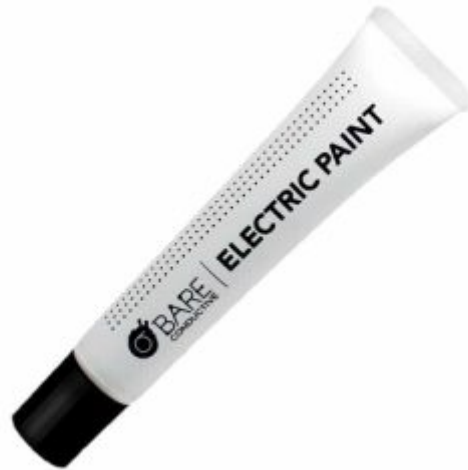
طلاء موصل للكهرباء