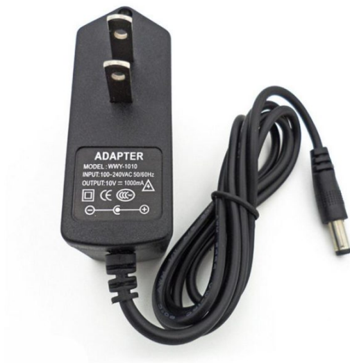
DC Power Supply