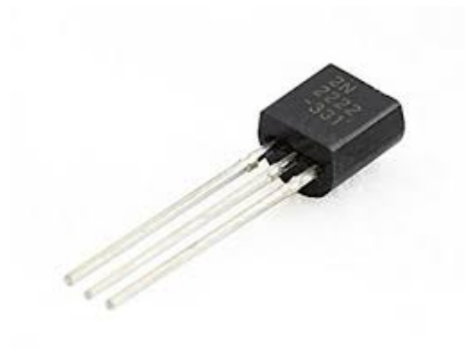
2n2222 NPN Transistor