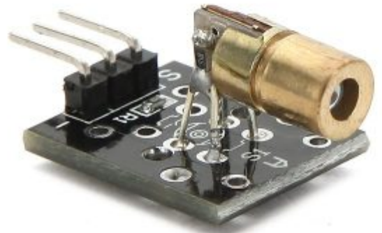
X 1 مرسل أشعة الليزر