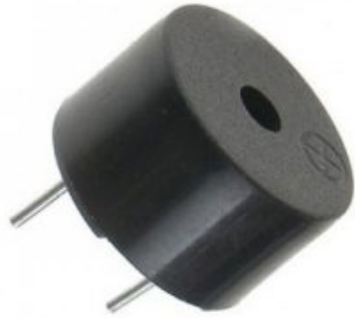
1 X مصدر صوت