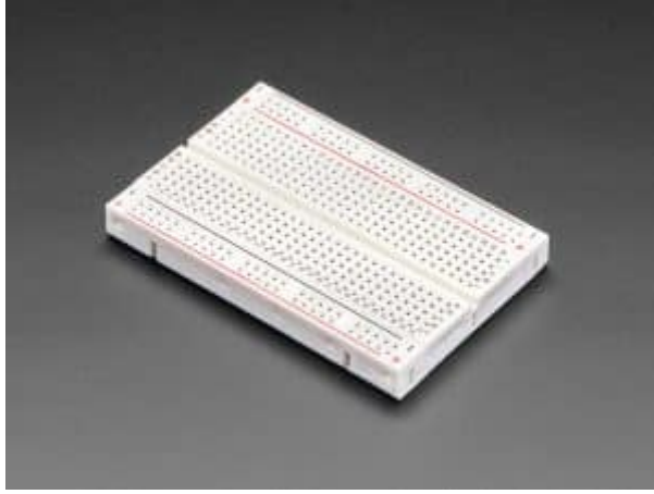
1 X لوحة تجارب