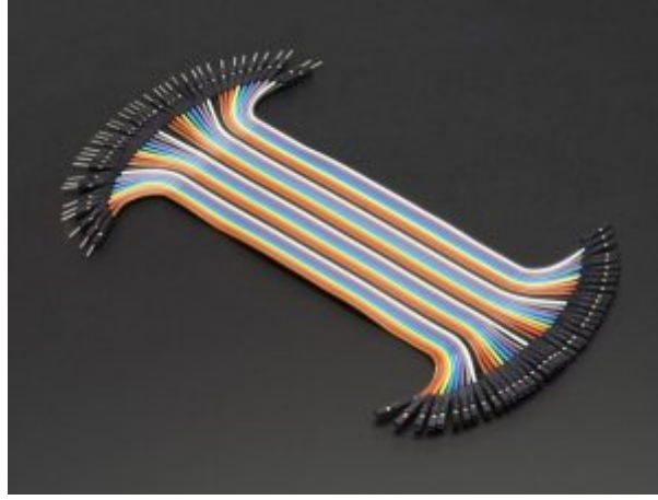
مجموعة أسلاك توصيل ( أنثى/ ذكر)