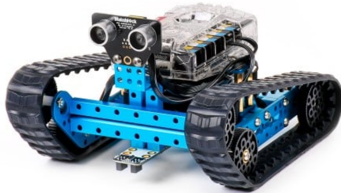
mBot Ranger Kit