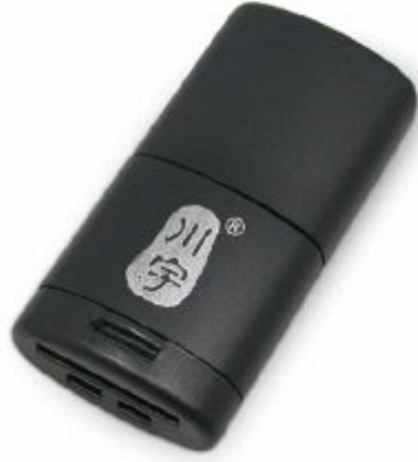
1X قارئ بطاقة الذاكرة