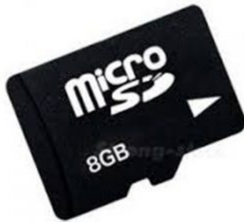
1X ذاكرة صغيرة (8 Micro SD card) قيقا كحد أدنى