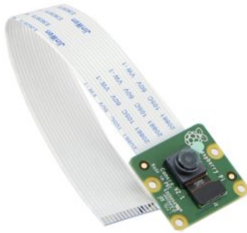
1X كاميرا للراسبيري باي (raspberry pi camera module) أو USB webcam