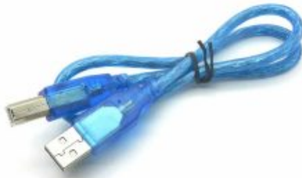
1X سلك يو اس بي (A-B) USB)