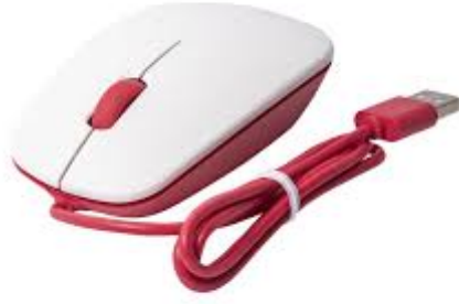
X1 فأرة تحكم *