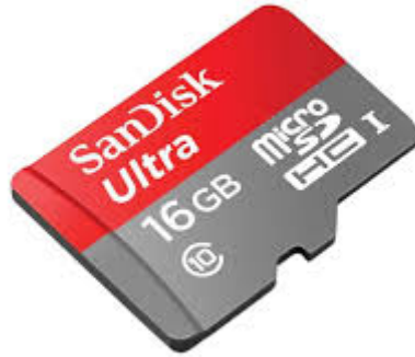
X1 كرت ذاكرة صغير