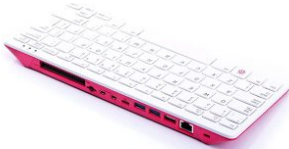
X1 لوحة مفاتيح *