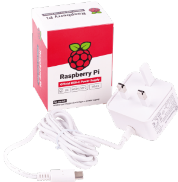
X1 محول طاقة *