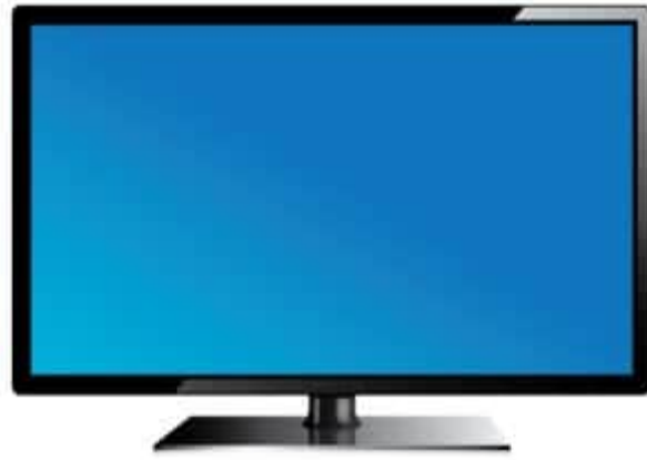
X1 شاشة **