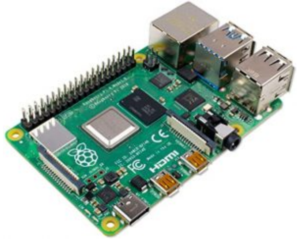
X1 راسبيري باي