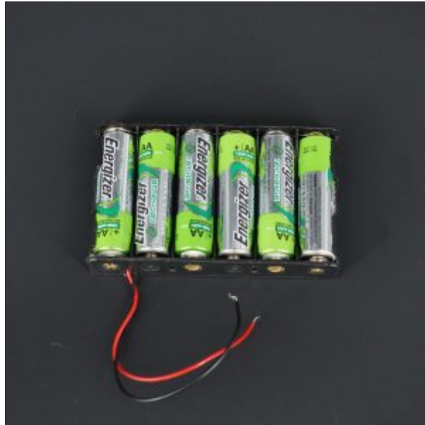
6X بطاريات (يفضل توفير حامل بطاريات لعدد 6)