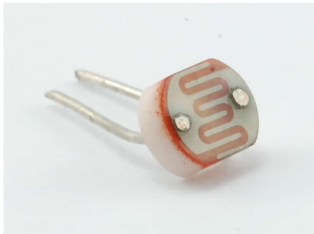
Light Dependent Resistor