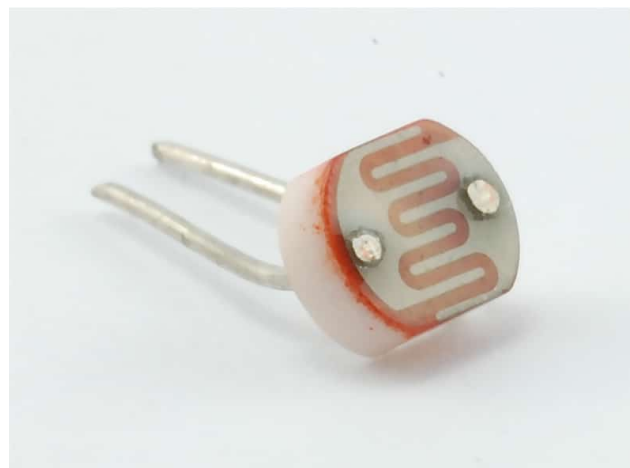
Light Dependent Resistor