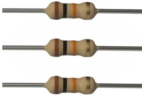
10K Ohm Resistor