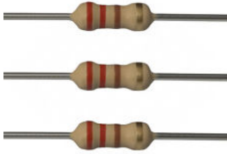
Ohm Resistor 220