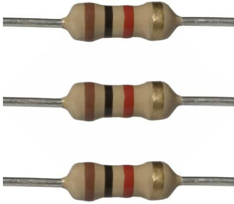
×1 مقاومة 1K \Omega