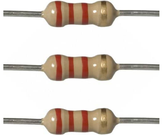
×1 مقاومة 2.2K \Omega