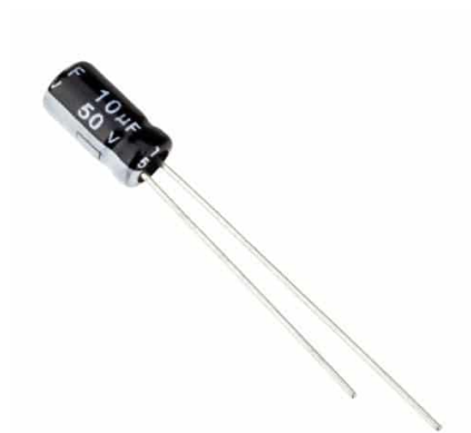
Capacitor 10uF 50V