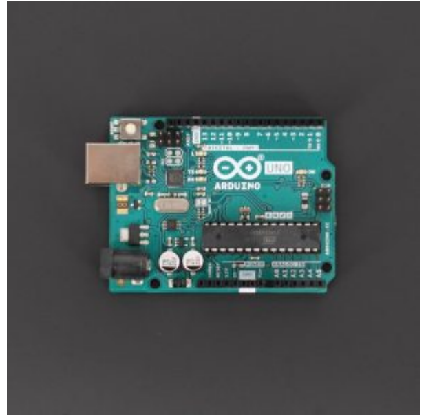
X1 اردوينو اونو