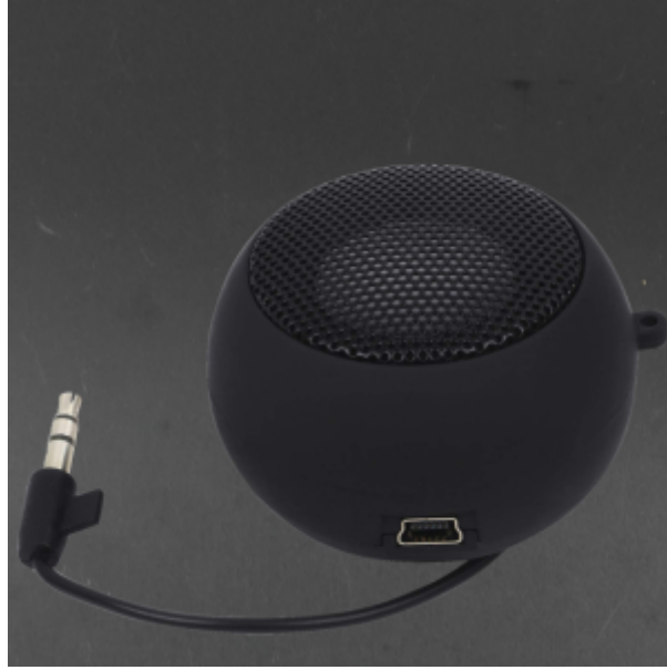
X1 1 مكبر صوت بمنفذ 3.5 مللي متر