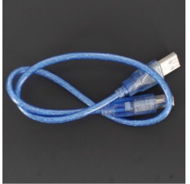
X1 سلك اردوينو