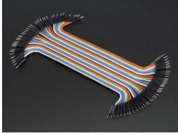
مجموعة أسلاك توصيل (ذكر / ذكر)