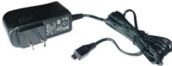
1X محول طاقة