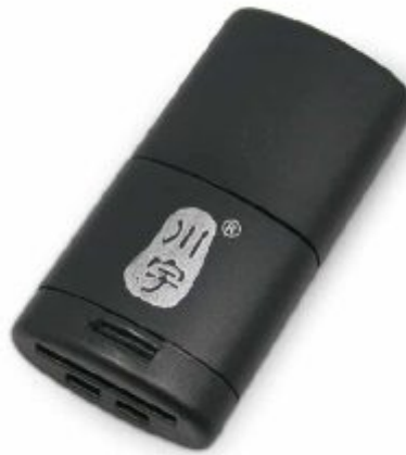
1X قارئ ذاكرة