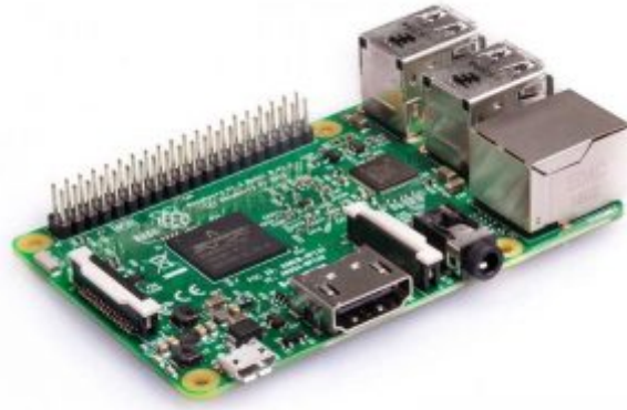
1X راسپيري باي