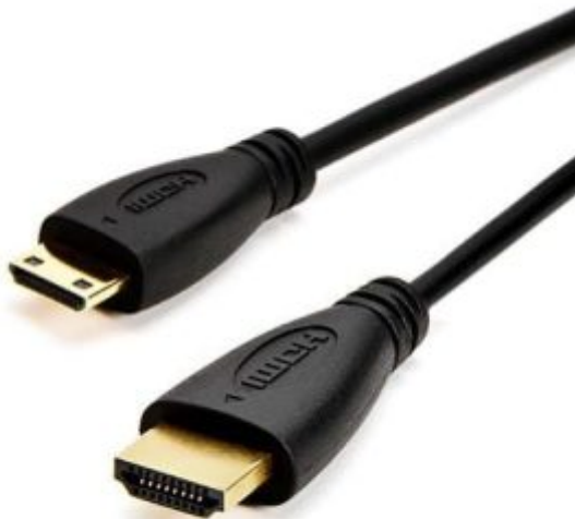
1X سلك (HDMI)