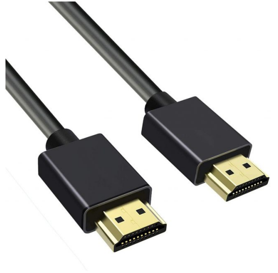
×1 سلك (HDMI)