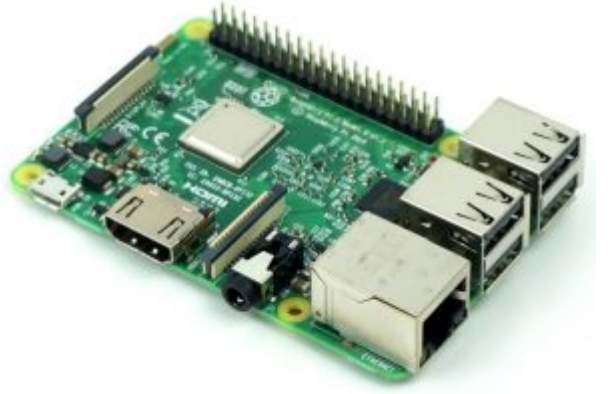
×1 راسبيري باي