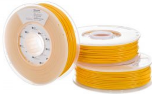
X1 خيوط الطابعة ثلاثية الأبعاد نوع (PLA) (اختياري)