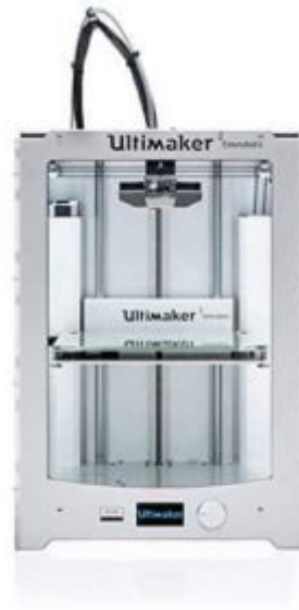
X1 طابعة ثلاثية الأبعاد (اختياري)