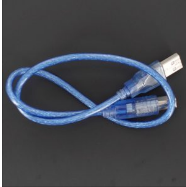
X1 سلك أردوينو