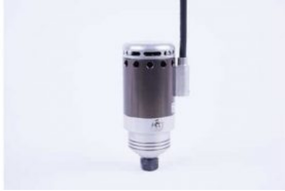
HF Spindle 500W