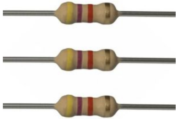
1 X مقاومة مقدار 4.7k