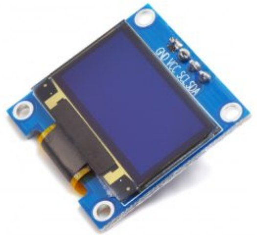
1 X شاشة عرض (OLED Display)