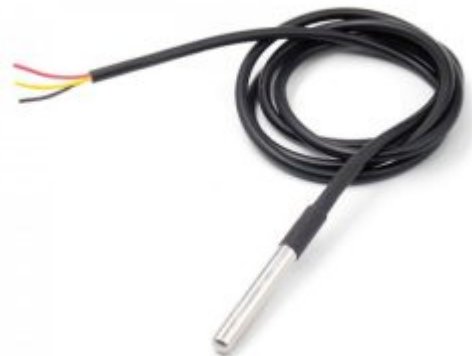
1 X حساس حرارة ( DS18B20 )