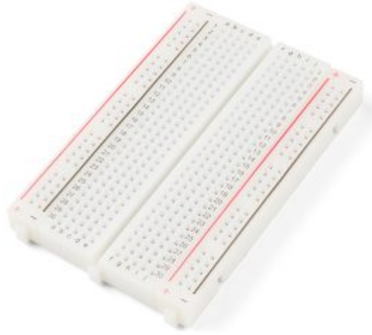
1X لوحة تجارب