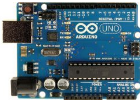
x1 اردوينو أونو