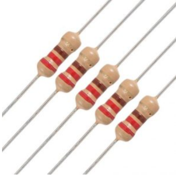
x2 مقاومة 220 أوم