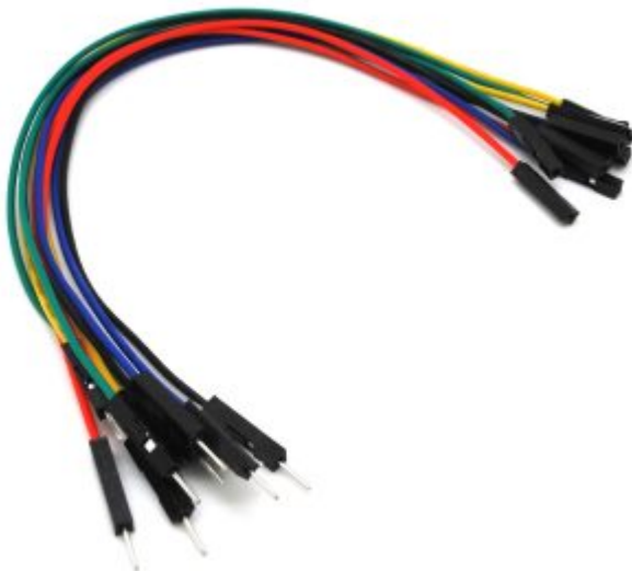
أسلاك توصيل (M/M)