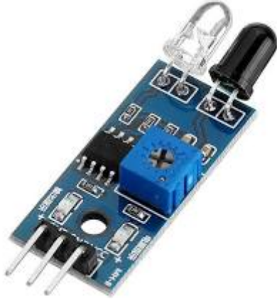
x2 مستشعر تجنب الحواجز بالأشعة تحت الحمراء