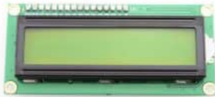
x1 شاشة كرسالية