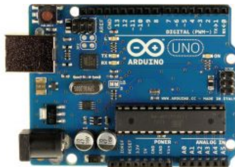
x1 اردوينو أونو