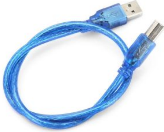
X1 سلك اردوينو