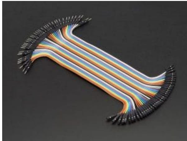
مجموعة أسلاك توصيل (M/F)