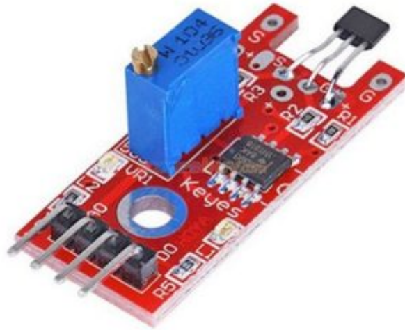
X1 مستشعر المغناطيسية