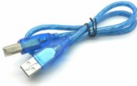
1X سلك يو اس بي (A-B) USB)