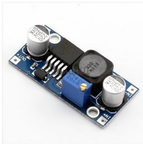
X1 منظم جهد (DC TO DC)