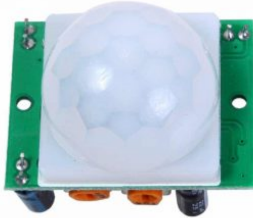
X1 حساس الحركة