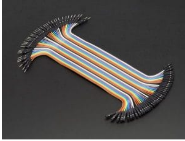
أسلاك توصيل (M/F)