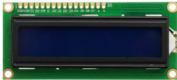
×1 شاشة كرسـتالية (LCD 2×16)