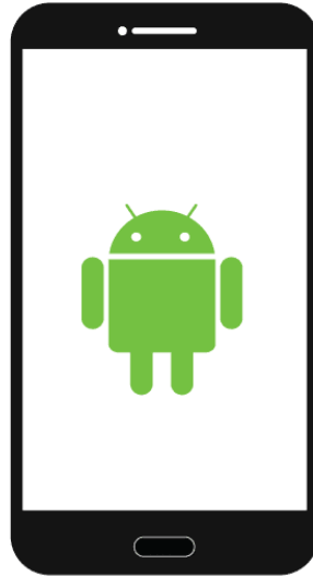
×1 هاتف نكي بنظام اندرويد