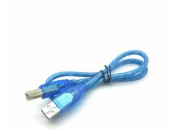
X1 سلك اردوينو