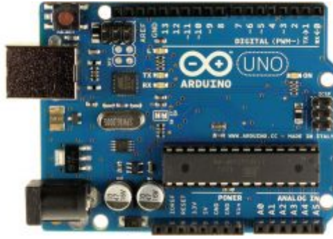
X1 اردوينو اونو