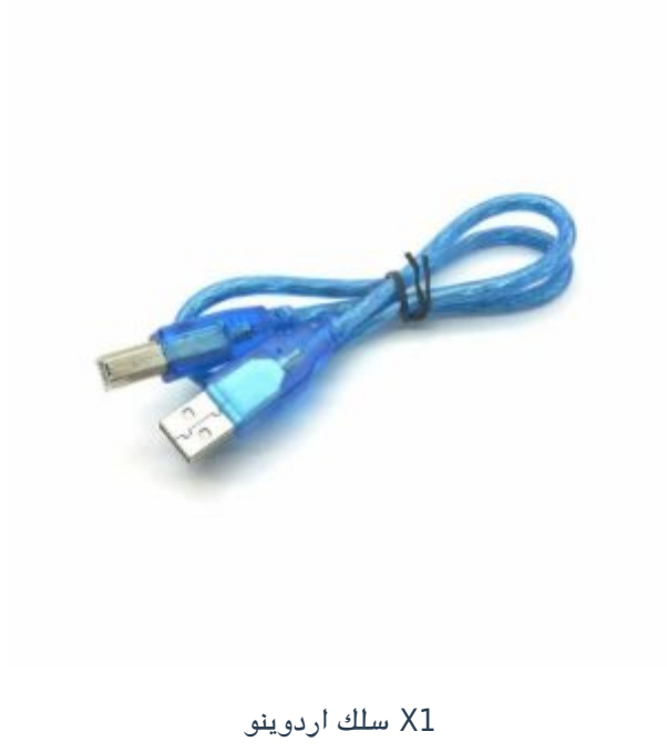
X1 سلك اردوينو