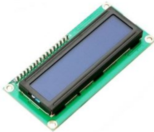
X1 الشاشة الكرسالية