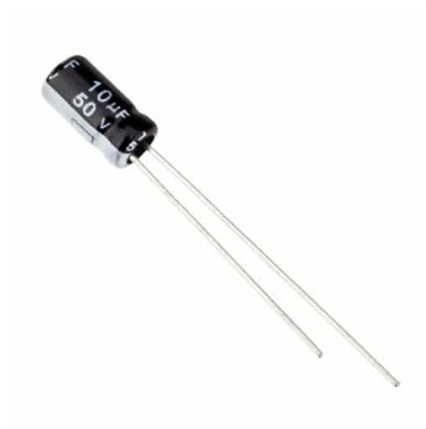
Capacitor 10uF 50V