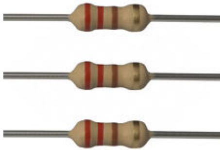
Ohm Resistor 220