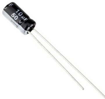
Capacitor 10uF 50V