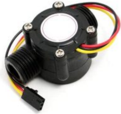
X1 حساس التدفق