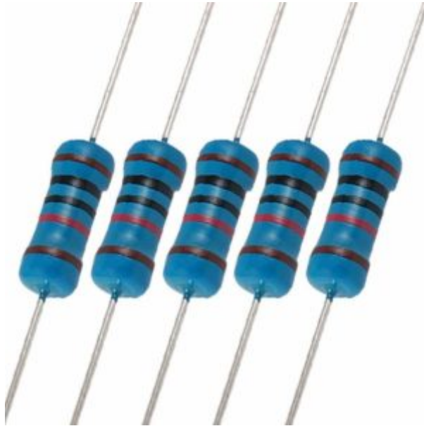
X8 مقاومة 10 كيلو أوم