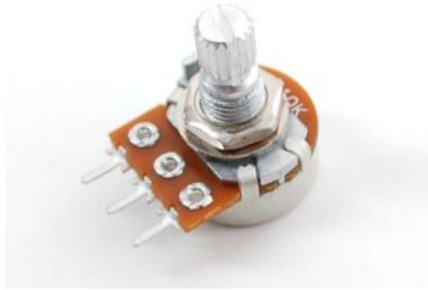
X1 مقاومة متغيرة