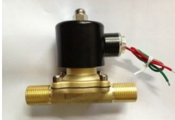
X1 ملف صمام