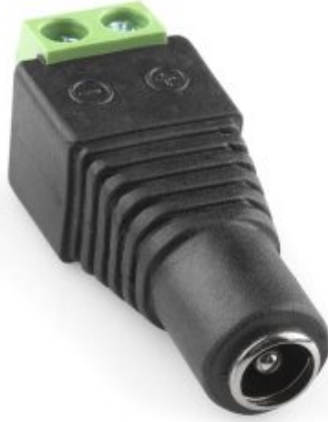
X1 وصلة تيار ثابت