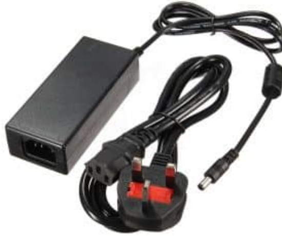
X1 مصدر طاقة 24 فولت