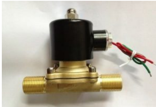
X1 ملف صمام