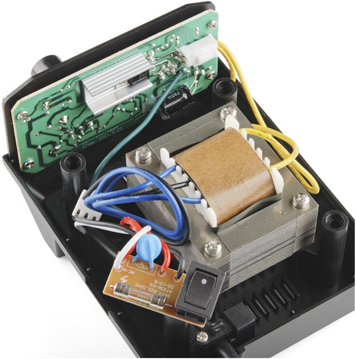
قاعدة كاوية اللحام من الداخل