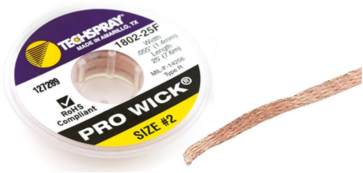
منظف الرأس (Tip Tinner)

هو عبارة عن معجون كيميائي يستخدم في تنظيف رأس الكاوية اللحام. وهو يتكون من حامض معتدل يساعد على ازالة البقايا العالقة على الرأس (تشبه إذابة الرأس بشكل مفاجئ على العنصر) كما يساعد على الحماية من الاكسدة (تكون المادة السوداء) التي تتراكم على رأس الكاوية اللحام في حالة عدم استخدامها .